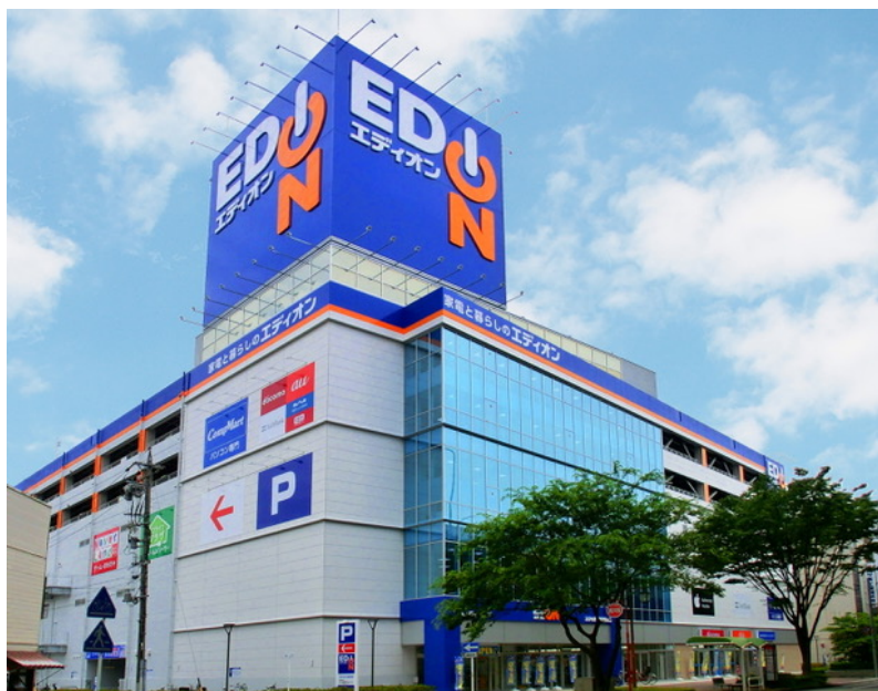
エディオン名古屋本店の外観

さらに名古屋ロボケアセンター及び同グループである大阪ロボケアセンターと岡山ロボケアセンターのトレーニングにおいて、クレジット機能付きエディオンカードをお持ちの方はトレーニング料金を5%OFFとさせていただきます。